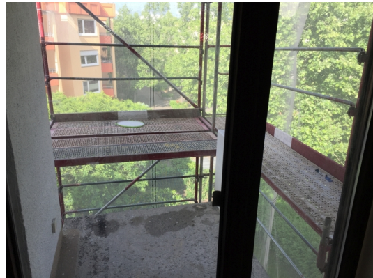
Balkon noch mit Baugerüst