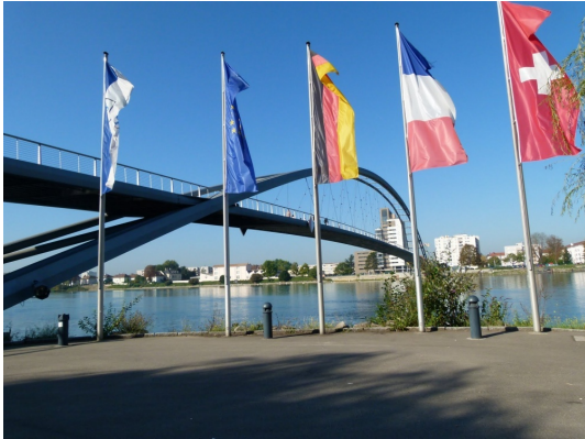
Passerelle Trois Pays zu Fuß