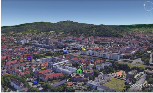
Im Herzen der Stadt