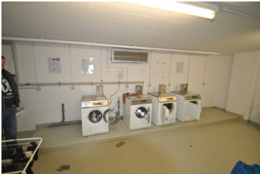
Wasch- und Trockenraum