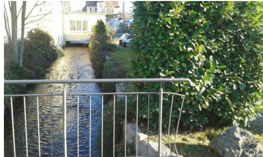
Idyllischer Bachlauf direkt am Hause