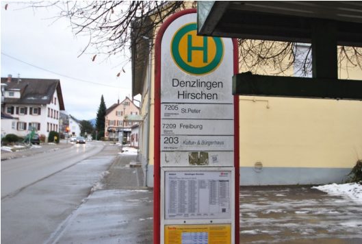
10m vom Hause