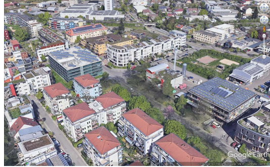
Straßenbahn und Geschäfte