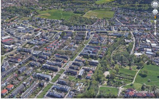
Straßenbahn und Geschäfte