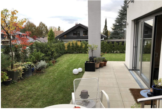
Privatgarten an der Terrasse