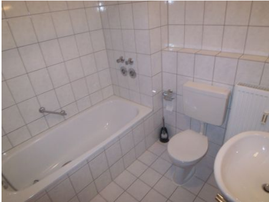
Wohnungsbeispiel aus dem Haus