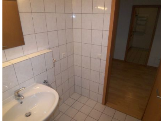
Wohnungsbeispiel aus dem Haus