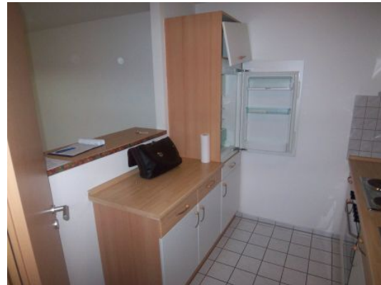
Wohnungsbeispiel aus den Haus