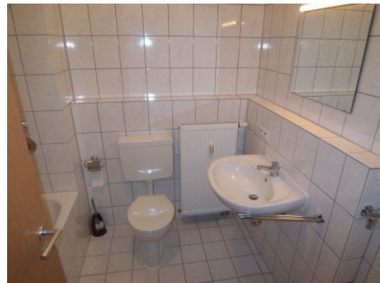
Wohnungsbeispiel aus dem Haus