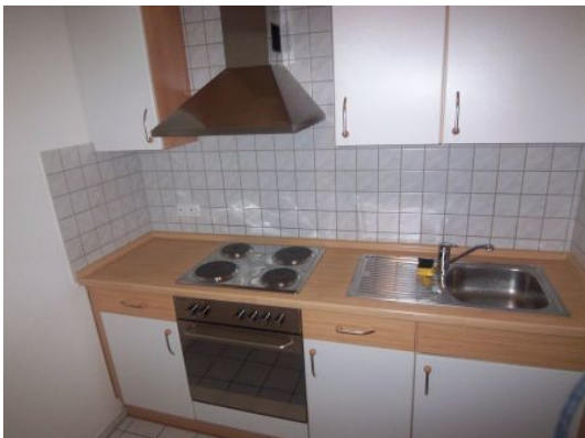
Wohnungsbeispiel aus dem Haus