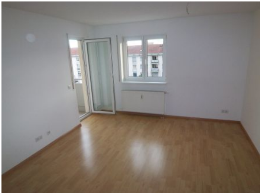
Wohnungsbeispiel aus dem Haus