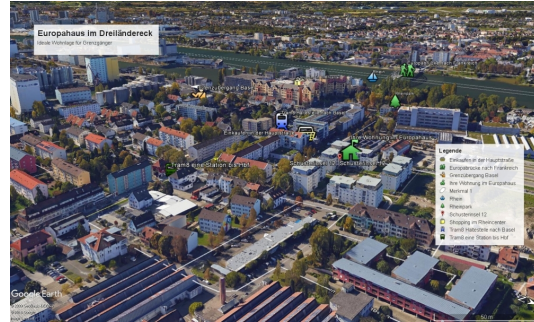
Direkt vor den Toren Basels