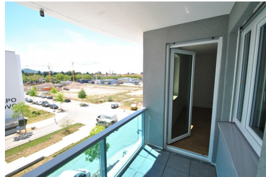
Abb. aus ähnlicher Whg. im Hause