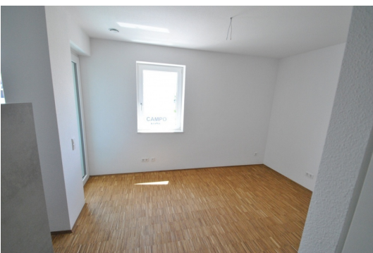
Abb. aus ähnlicher Whg. im Hause