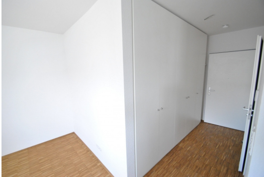
Abb. aus ähnlicher Whg. im Hause