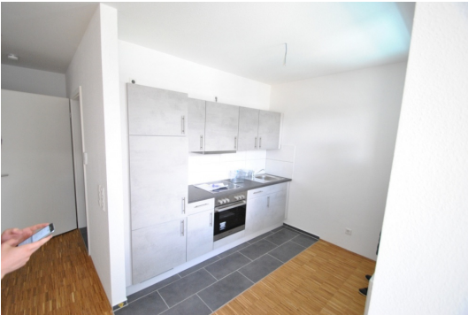
Abb. aus ähnlicher Whg. im Hause