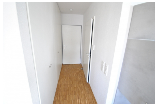
Abb. aus ähnlicher Whg. im Hause