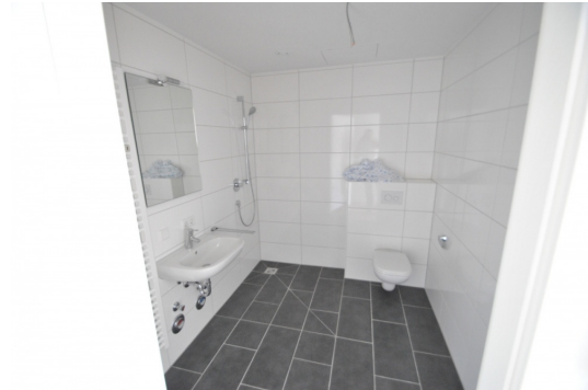
Abb. aus ähnlicher Whg. im Hause