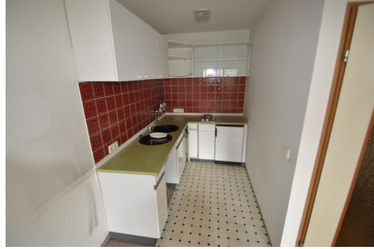
EBK inzwischen verändert