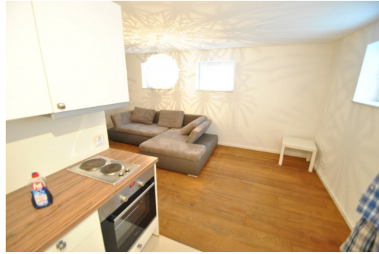
Herd mit 4 Gerranfelder wird noch verbaut