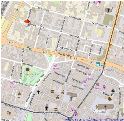
Ruhige Lage Stadtmittle