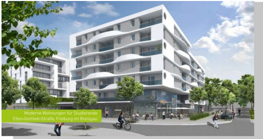
Moderne Wohnungen für Studierende Ellen-Gottlieb-Straße Freiburg im Breisgau