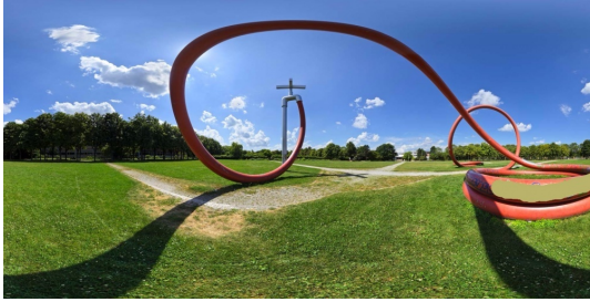
Eingang zum Eschholzpark gegenüber des Hauses