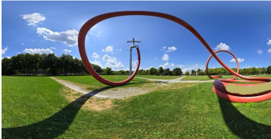
Eingang zum Eschholzpark gegenüber des Hauses