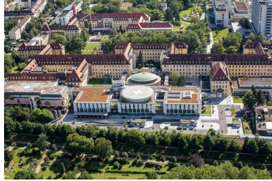
Uniklinikum nur 200m