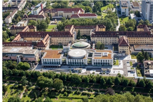
Uniklinikum nur 200m