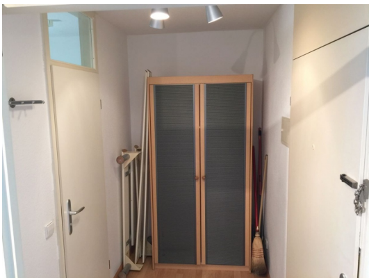
Cleverer Grundriss mit Gaderobe im Flur