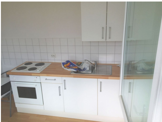
Moderne Einbauküche inkl.