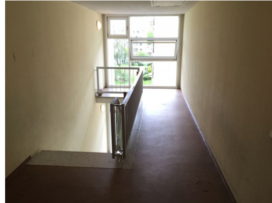
Im 3.OG ohne Aufzug, mit lichtem Treppenhaus