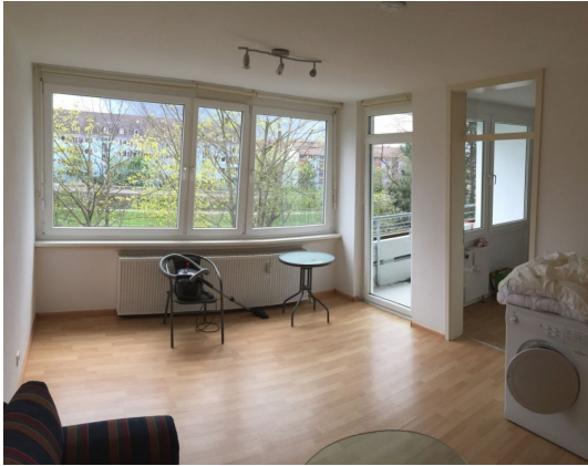
Lassen Sie die Sonnen in die Wohnung