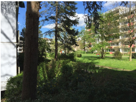
Gärtnerisch gepflegtes Grundstück