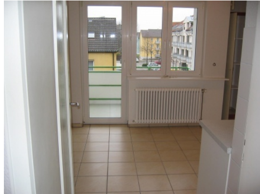
Beispielbilder aus Nachbarwohnung