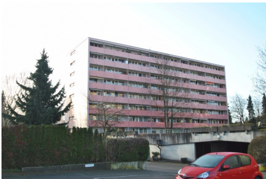
Große und gepflegte Wohnanlage