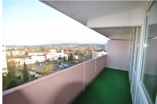
Mehrwert! Viel Platz auf dem Balkon.