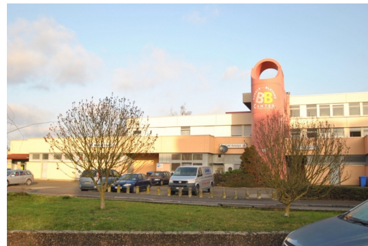
Direkt ggü. das Einkaufszentrum