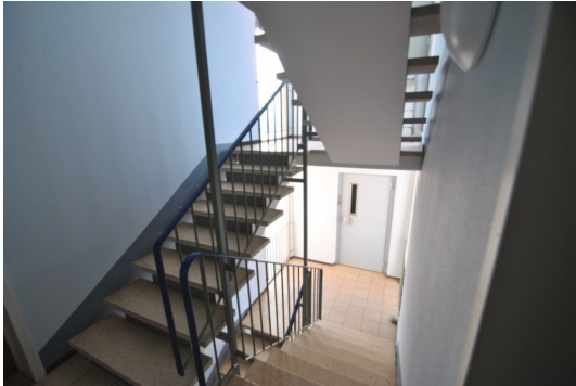
Treppenhaus mit Aufzug