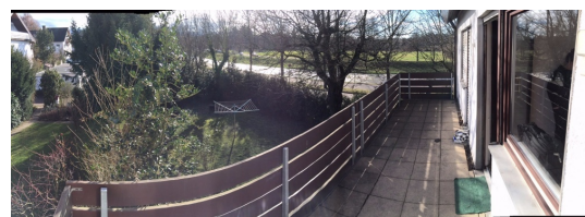
Optional zusätzliches Zimmer im 1.OG