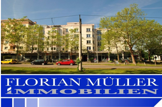
Gesuchte Lage mit hohem Freizeitwert