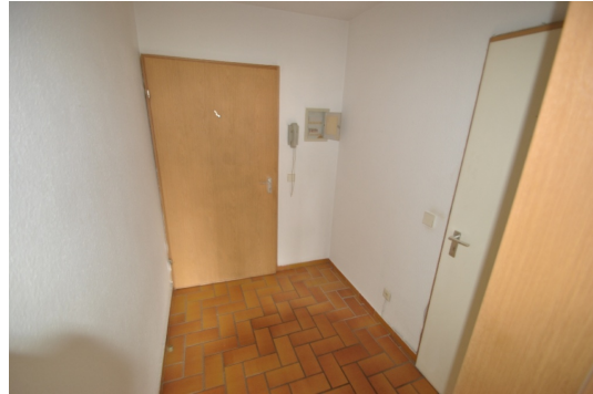
Alle Bilder sind Beispiel aus der Nachbarwohnung