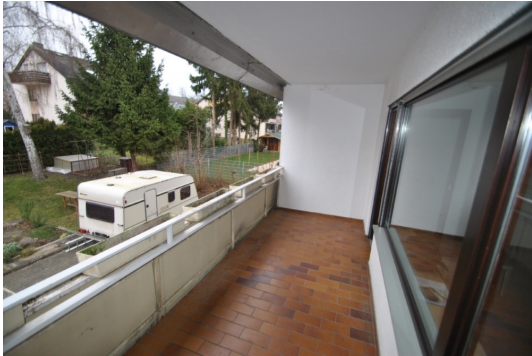
Beispiel, Dachterrasse noch größer